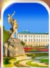
MIRABELL PALACE AUSTRIA