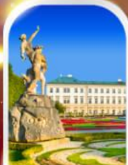
MIRABELL PALACE AUSTRIA