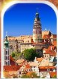
CESKY KRUMLOV CZECH