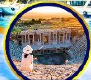
นครเฮลิโกราฟัส