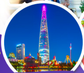
ตึกลิโอดเต็มจลล์

• ช้อปบิง 6 แบนด์ดัง POP Mart / Carlyn / Stand Oil / Emis / Marithe / Mardi