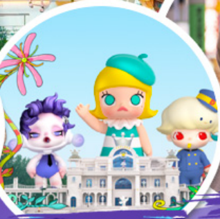
ช้อปบิง POP MART