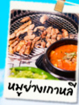
หมูย่างเกาหลี