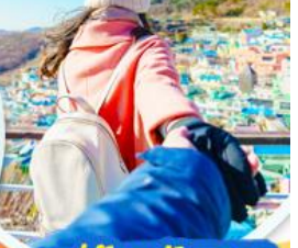
หมู่บ้านคัมซอน

สายการบินแอร์ปูซาน (BX) <ชั้นเครื่องสุวรรณภูมิ>