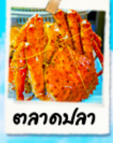
ตลาดมัลลา