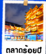
ตลาดร้อยปี