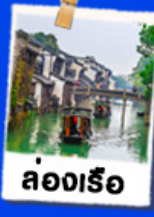
ล่องเรือ