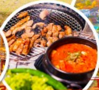
ตัวอย่างเกาหลี