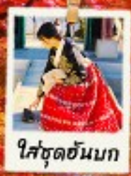
ใส่ชุดฮันบก