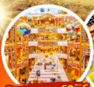
ห้องสมุดสตาร์ฟิสต์