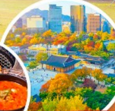
พระราชวังเคียงอกซูกุง