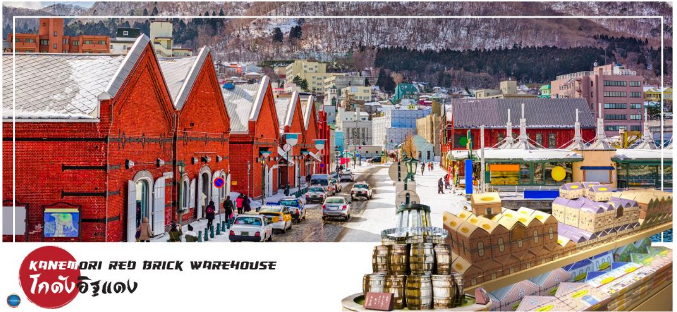
KANEMORI RED BRICK WAREHOUSE โกดังอิฐแดง

วันที่สาม เมืองฮาโกดาเตะ – โกดังอิฐแดง – ย่านเมืองเก่าโมโตมาชิ – ป้อมโกเรียวคาค (เข้าชม) – อุทยานแห่งชาติทะเลสาบโทยะ – ทะเลสาบโทยะ – ออนเซน