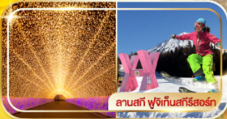
ลานสกี ฟุจิกั้นสกีรีสอร์ท