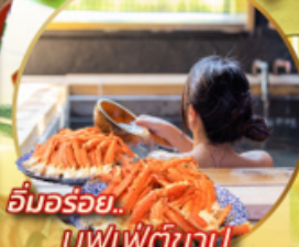
อิมมอร์รี่... บุฟเฟ่ต์ชาบู