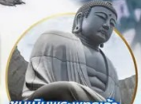
ชมเนินพระพุทธรเจ้า.. Hill of the Buddha

📍 ไฮไลท์!! สนุกสนานกับกิจกรรมทะเลหิมะ ณ ลานสโนว์ เวิลด์ ฮักไซฟาโนรามา เยี่ยมชมเนินพระพุทธรเจ้า ชมความน่ารักเหล่าสัตว์ ณ สวนสัตว์อาซาฮิยาม่า ชมคลองโอดาธา เข้าชมพิพิธภัณฑ์ถักสโองดนตรี สัมรสราเมง ณ หมู่บ้านราเมนอาซาฮิคาว่า ช้อปบิงจูดิจ กาคุกุโคจิ อีเมอร์ออย!! บุปเฟ่ต์ซาบู และซาบูยักนิ