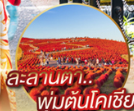
ละลานตา.. พุ่มต้นโคเซียว