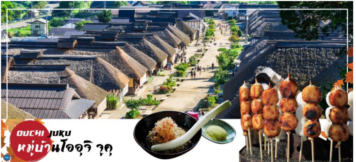
OUCHI JUKU หมู่บ้านโออุจิ จุก

บริเวณใกล้เคียงก็นำท่านสู่ สถานีรถไฟยุโนคามิ ออนเซ็น (Yunokami Onsen Station) (ใช้เวลาเดินทางประมาณ 10 นาที) โดยเป็นสถานีรถไฟเพียงแห่งเดียวของญี่ปุ่นที่มีอาคารสถานีทำจากหลังคาแบบญี่ปุ่นโบราณ !!!ไฮไลท์ อิสระให้ท่านเพลิดเพลินกับการแช่เท้าผ่อนคลายตามอัธยาศัย ณ จุดออนเซนเท้าที่สถานีแห่งนี้