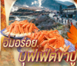
อมรอรอย..บุฟเฟ่ต์งาบู