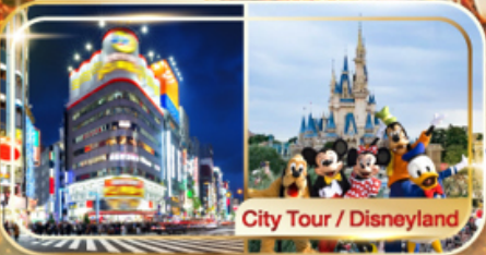
City Tour / Disneyland