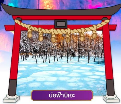
บ่อฟ้าบิเอะ