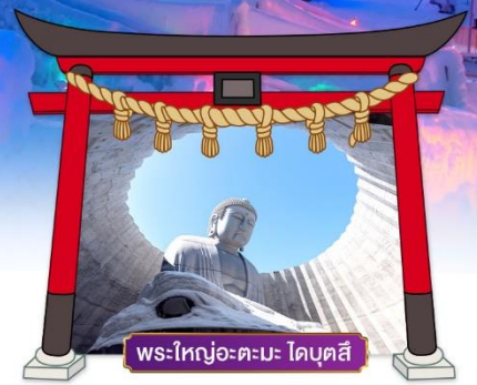
พระใหญ่อะตะมะ ไดบุตสึ