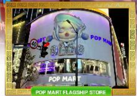
POP MART FLAGSHIP STORE