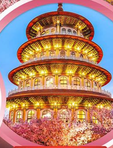
วัดจู้เทียนหยวน

ช้อปปิ้งจุใจ ย่านซีเหมินติง ตลาดไทจงไนท์มาร์เก็ต อัมม่อร้อยกับ..เมนูปลาประธนาธิบดี ชาบูบุฟเฟ่ต์สไตล์ไต้หวัน เสี่ยวหลงเปา