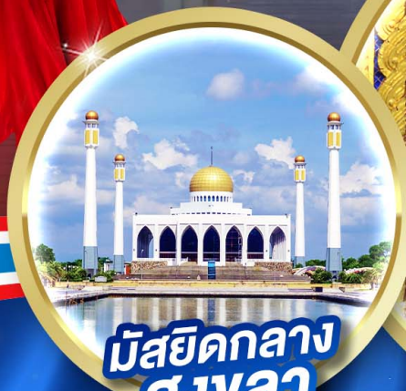
มัสยิดกลาง สงขลา