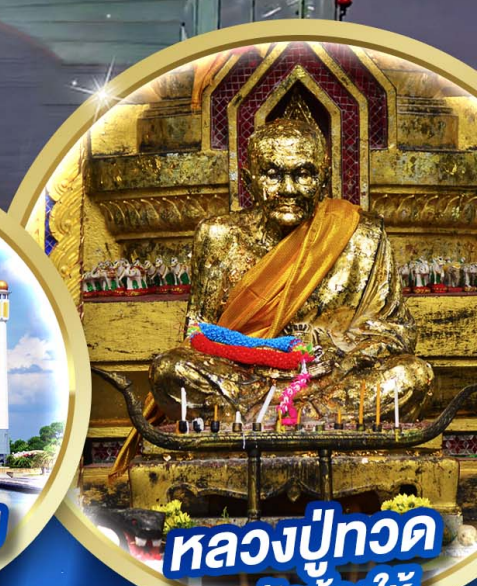
หลวงปู่ทวด ณ วัดช้างให้