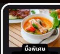
มือพิเศษ อาหารไทยในยุโรป