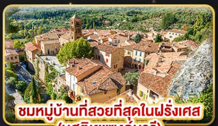
ชมหมู่บ้านที่สวยงามที่สุดในฝรั่งเศส (มุสตีเยแซงท์มารี)