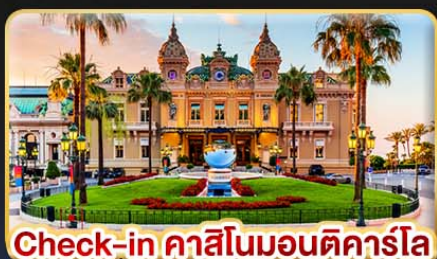
Check-in คาสิโนมอนติคาร์โล