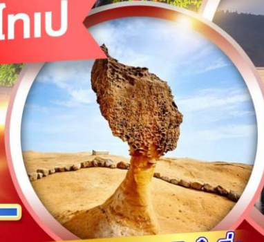
อุทยานแห่งชาติยี่หลิว

ช้อปปี้งจู้ใจ 3 ตลาดกลางคืนชื่อดัง วัดเหวินหฺงู ถ่ายรูปโรงละครแห่งชาติโดจง ขอความรักวัดหลงซาน หมู่บ้านโบราณจิวเฟิน ถ่ายรูปกับตึก 101 อนุสรณ์สถานเจียงไคเช็ค