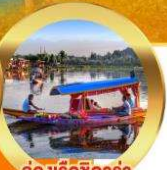
ล่องเรือชิคาร่า