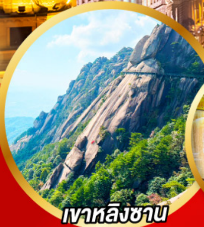
เวาหลิงซาน