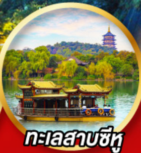
ทะเลสาบซีหู