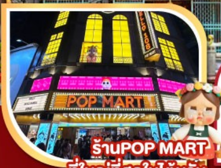
ร้านPOP MART ที่ใหญ่ที่สุดในไต้หวัน