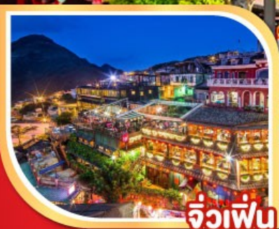
จิ่วเฟิ่น