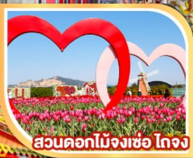
สวนดอกไม้จงเซอ ไทจง