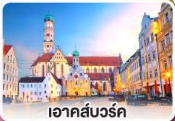
เอาคส์บวร์ค