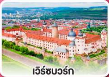
เว็ร์ชบวร์ค

เที่ยวเก็บครบเส้นทาง สายโรแมนติก เยอรมัน จากเว็ร์ชบวร์คสู่เอาคส์บวร์ค