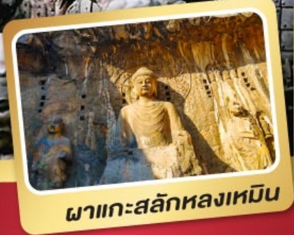
ผาแกะสลักหลงเหมิน