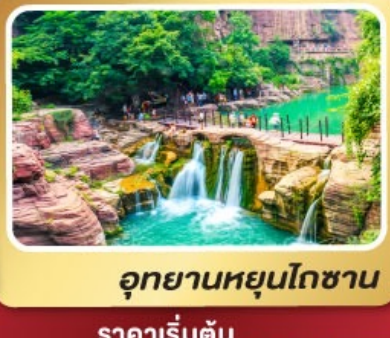
อุทยานหยุ่นโกซ่าน