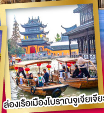
ล่องเรือเมืองโบราณจูเจียเจียว