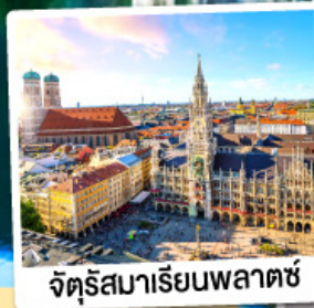
จัตุรัสมาเรียนพลาตซ์