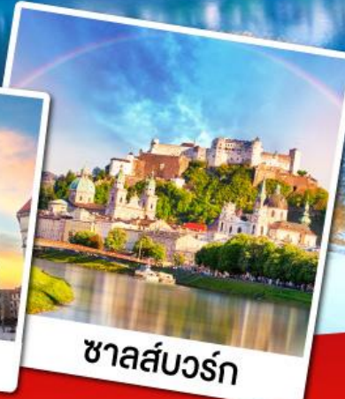
ซาลส์บวร์ก