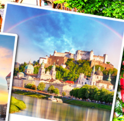
ซาลส์บวร์ก