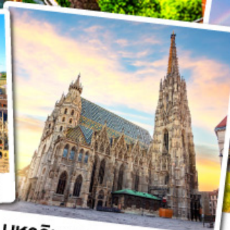
มหาวิหารเซนต์สตีเฟน