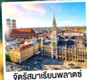
จัตุรัสมาเรียนพลาตซ์

15-21 ต.ค. 67 28 ก.พ.-06 มี.ค. / 12-18 มี.ค. 68 28 มี.ค.-03 เม.ย. / 03-09, 10-16 เม.ย. 68 25 เม.ย.-01 พ.ค. / 29 เม.ย.-05 พ.ค. 68