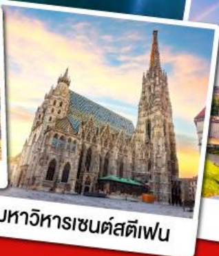
มหาวิหารเซนต์สตีเฟน