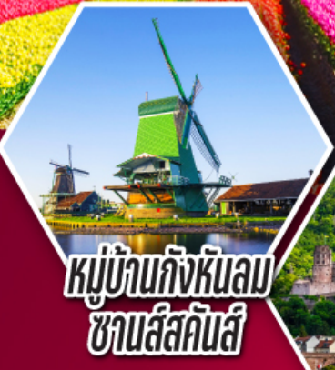
หมู่บ้านกังหันลม ซานส์คินส์