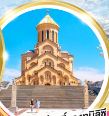
วิหารศักดิ์สิทธิ์ของทบิลีซี