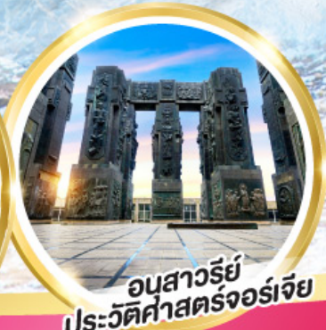
อนุสาวรีย์ประวัติศาสตร์จอร์เจีย