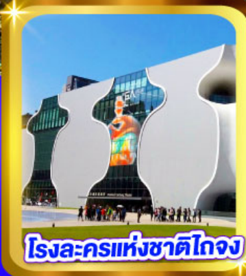
โรจระครแห่งชาติไทจง