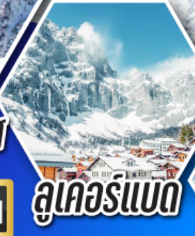
ลูเคอร์เนด