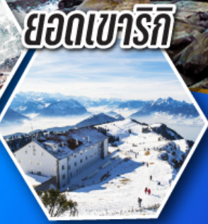
ยอดเขาริก

ชมมหาธารน้ำแข็งยักษ์ อาเลซ กลาซีเยร์ แห่งยอดเขาออกกิสฮอร์น ราคาเริ่มต้น