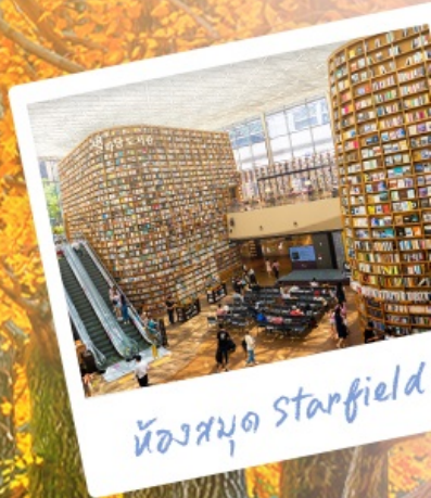
ห้องสมุด Starfield