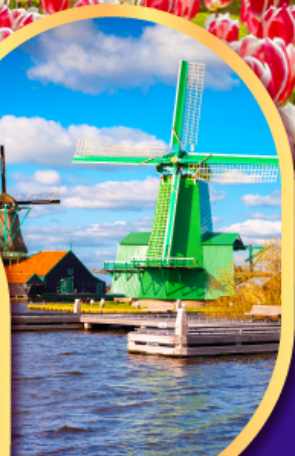
หมู่บ้านกังหันลม ซาสคินส์

08-16 ก.พ.68 09-17, 10-18 เม.ย.68 23 เม.ย.-01 พ.ค.68