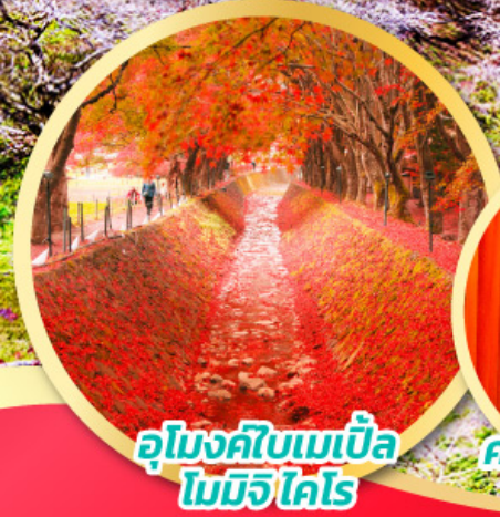
อุโมงค์ใบเมเปิ้ล โมมิจิ ไคโร