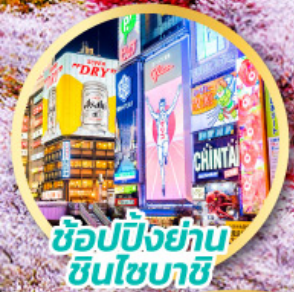
ช้อปปิ้งย่าน ชินโซบาชิ