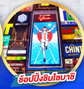
ช้อปปิ้งชินโซบาชิ

เดินทาง 14-19, 21-26 ม.ค. 68 06-11, 13-18 ก.พ. 68 13-18 มี.ค. 68