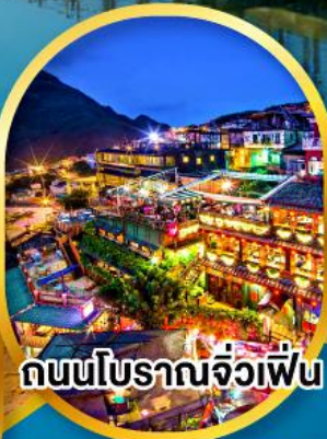
ถนนโบราณจิวเฟิน