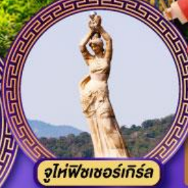
จูไห่พีชชอร์เทิล