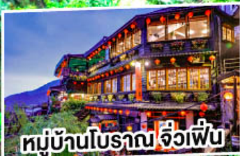
หมู่บ้านโบราณ จ้วเพื่อน