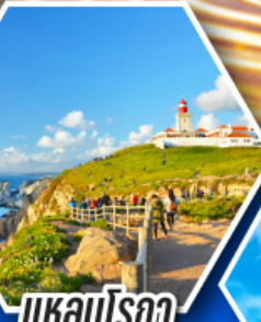
แหลมโรกา