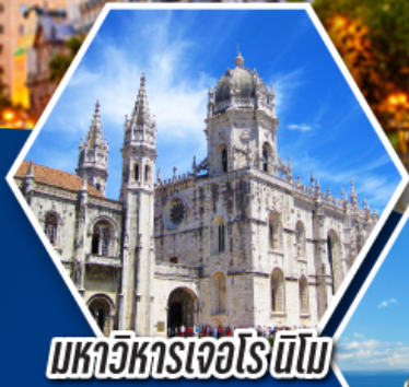
มหาวิหารเจอโรนิโม