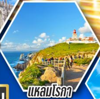
แหลมโรกา