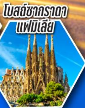
โบสถ์ซากราดา แฟมิลีย