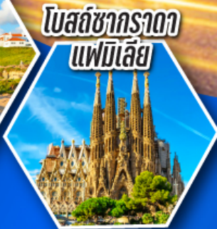
โบสถ์ซากราดาแฟมิลีย