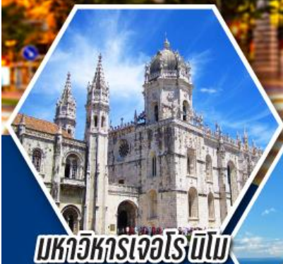
มหาวิหารเจอโรนิโม