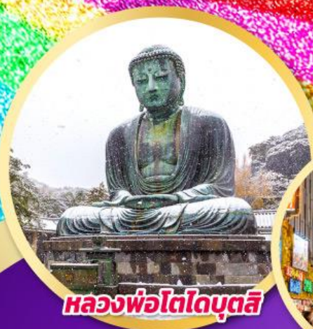
หลวงพ่อโตโคบูตสึ