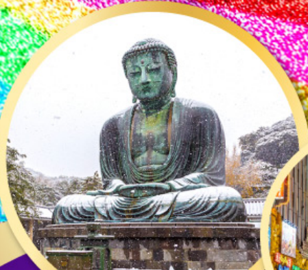
หลวงพ่อโตโคบูตสึ