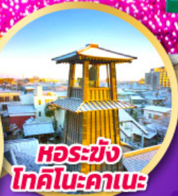
หอรบั้ง โทคิโนะคานะ