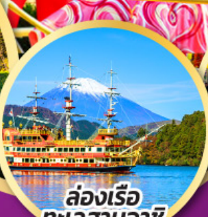
ล่องเรือ ทะเลสาบอาชิ