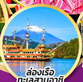
ล่องเรือ ทะเลสาบอาชิ