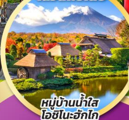
หมู่บ้านน้ำใส โอชิโนะฮักไก