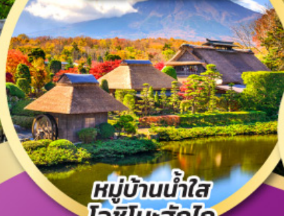
หมู่บ้านน้ำใส โอชิโนะอ๊กโก