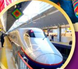
รถไฟชินคันเซ็น

พักโอซาก้า 1 คืน พักโตเกียว 2 คืน พักออนเซ็น 1 คืน พร้อมเมนูชาบูยักษ์