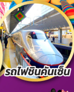
รถไฟชินคันเซ็น