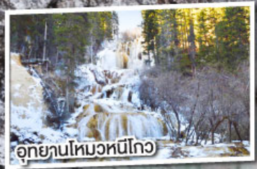
อุทยานโหมวหนี่โกว