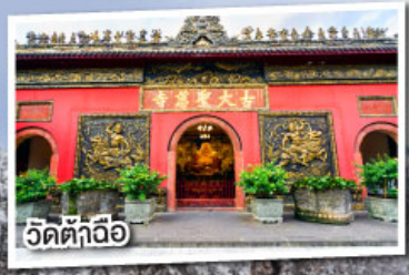
วัดต้าถื่อ