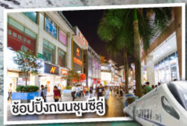
ช้อปปิ้งถนนชุนชี่