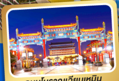
ถนนโบราณเทียนเหมิน