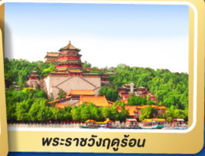
พระราชวังฤดูร้อน