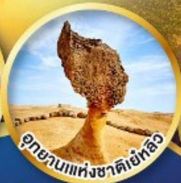
อุทยานแห่งชาติเย้หลิว