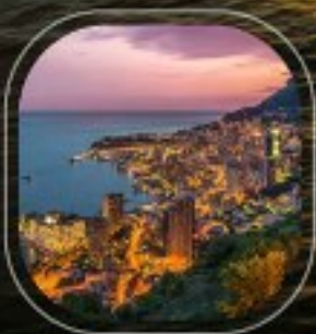
Monaco Monte Carlo