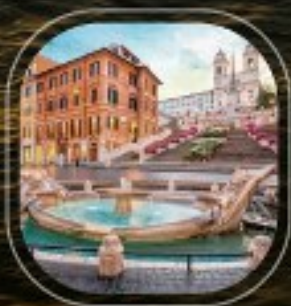
Italy Civitavecchia (Rome)

กำหนด : 10 ตุลาคม, 11 พฤศจิกายน, 12 ธันวาคม | ราคาใบเรือ : ค่าค่าตัว, ค่าเครื่องดื่ม, ค่าสัมภาระ, ค่าประกัน