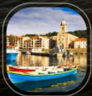
France Port Vendres