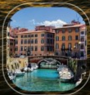
Italy Livorno (Tuscany)