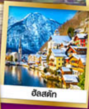
ฮิลส์ตัท