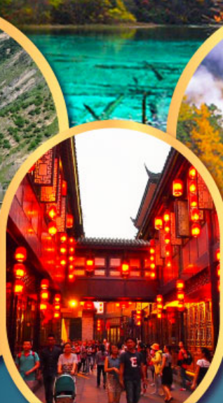
ถนนโบราณจีนหลี่