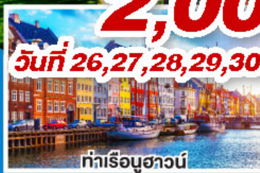
ท่าเรือฮาวน์

ล่องเรือสำราญสุดหรู DFDS พร้อมห้องพักแบบ Sea View