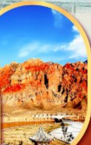
หุบเขาห้าสี อุทยานธรณีกุยเต๋อ