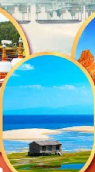
ทะเลสาบชิงไห่