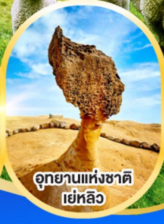
อุทยานแห่งชาติ เย่หลิว