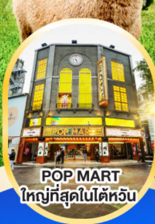
POP MART ใหญ่ที่สุดในไต้หวัน