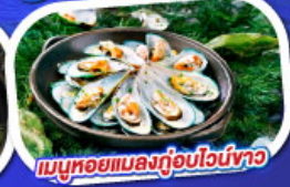
เมนูหอยแมลงภู่อูบไวน์ขาว