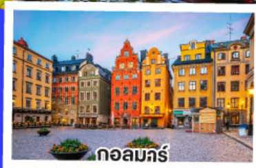
กอลมาร์ท

ทานอาหาร ณภัตตาคารบนหอไอเฟล พร้อมชมวิวแสนโรแมนติก