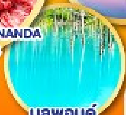
บรูพอนด์ (บ่อน้ำสีฟ้า)